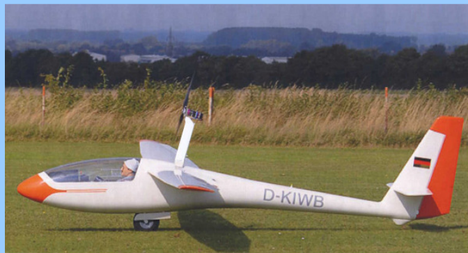
ASW 15 6m Spannweite 19,6kg

Inclusiv: wie Kit 2, plus SM -Klapptriebwerksteuerung, Regler YGE oder Schulze Elektronik , Motorkennlinie mit Leistungsdaten.